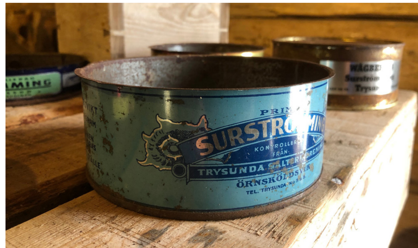
Surströmming är ett resultat av att vi förr behövde salta, torka och syra livsmedel för att de skulle hålla längre, en tradition som lever kvar än idag.

Partnerskapet för den regionala livsmedelsstrategin bildades år 2015 i och med att länets första regionala livsmedelsstrategi togs fram, som den första i sitt slag i landet. Partnerskapet har bestått av: Hushållnings-sällskapet Västernorrland, Lantbrukarnas riksförbund Västernorrland, Lantmännen Västernorrland, Länsstyrelsen Västernorrland, Maskinringen Västernorrland, Norrmejerier, Nyhléns Hugosons, Region Västernorrland och Växa Sverige.