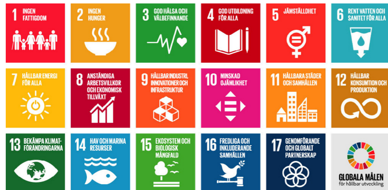
De 17 globala målen i Agenda 2030 rör de tre dimensionerna ekonomisk, social och miljömässig hållbarhet.