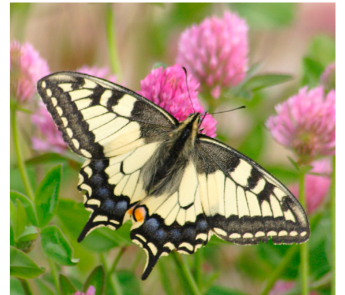
Betande djur är en förutsättning för att hålla landskapet öppet och bevara den biologiska mångfalden.