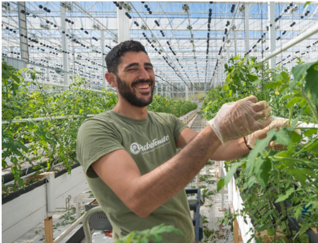
Peckas naturodlingar i Härnösand är ett exempel på nya sätt att producera livsmedel, där regnbågslax och tomater odlas i ett gemensamt system genom kretsloppsodling.