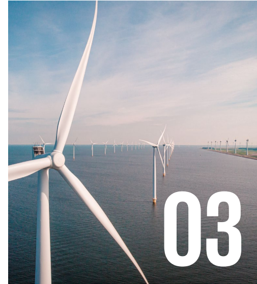
Resultat av granskningen