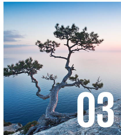
Resultat av granskning